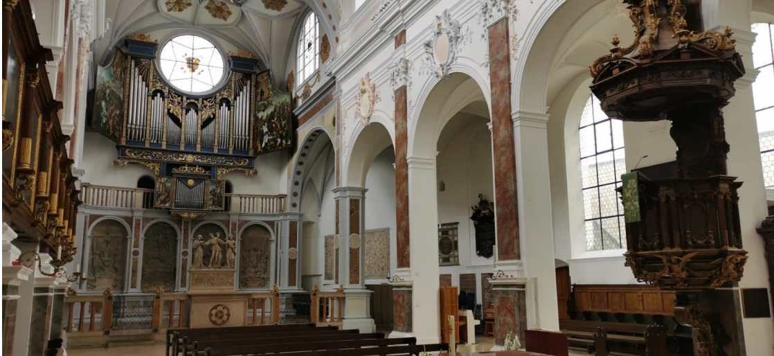
St. Anna Augsburg